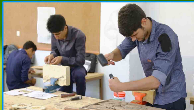
مزیت ها و افتخارات دانشکده هنر