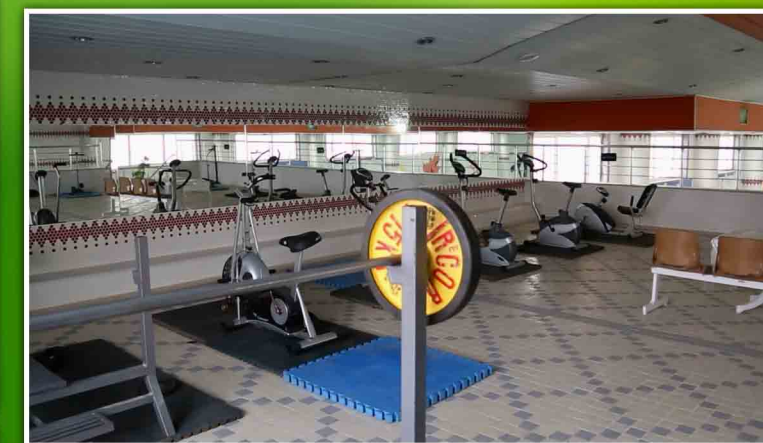
مزیت ها و افتخارات پردیس علوم رفتاری

رشته تربیت بدنی و علوم ورزشی دانشگاه بیرجند از سال ۱۳۷۴ با گزینش ۳۰ دانشجو در دوره روزانه در دل دانشکده ادبیات و علوم انسانی تاسیس گردید.