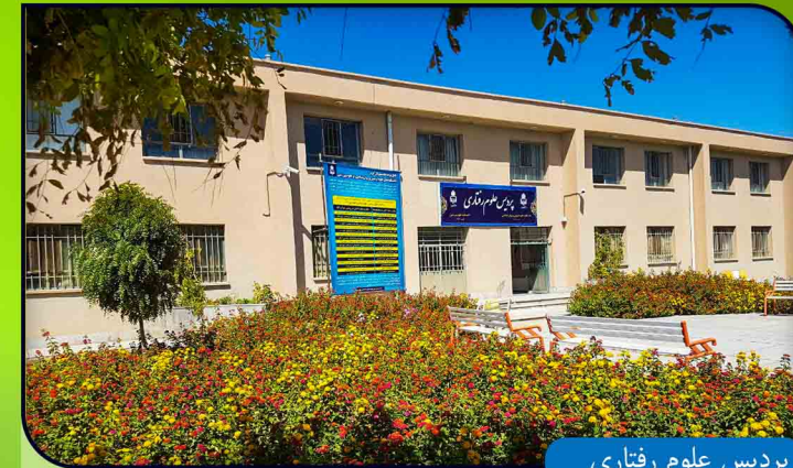
پردیس علوم رفتاری

پردیس علوم رفتاری متشکل از دو دانشکده علوم تربیتی و روانشناسی و دانشکده تربیت بدنی می باشد. دانشگاه بیرجند از سال ۱۳۷۱ نسبت به پذیرش دانشجو در رشته علوم تربیتی اقدام نمود و با تداوم پذیرش دانشجو در رشته های علم اطلاعات و دانش شناسی (۱۳۷۳) و روانشناسی (۱۳۸۵) زمینه ایجاد دانشکده مستقل فراهم آمد.