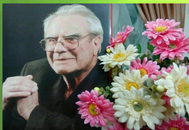
روانشاد دکتر غلامحسین شکوهی پدر تعلیم و تربیت نوین